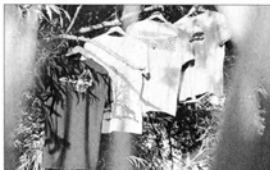
Ob Hai, Leopard, Wolf oder Wisent: Genau wie bei der Damenrezieren auch bei der Herren-Kollektion „Fragile“ Motive bedrohter Tierarten die T-Shirts – zumeist auf der Rückseite.